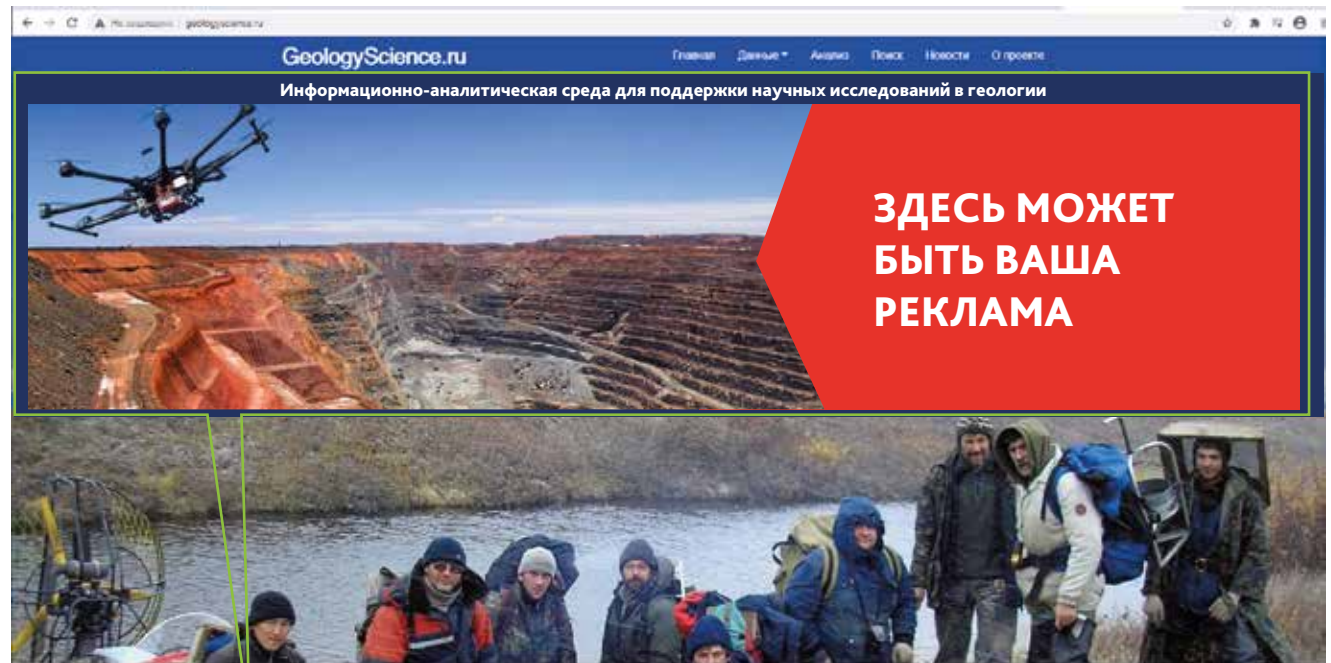
Баннер на сайте www.geologyscience.ru