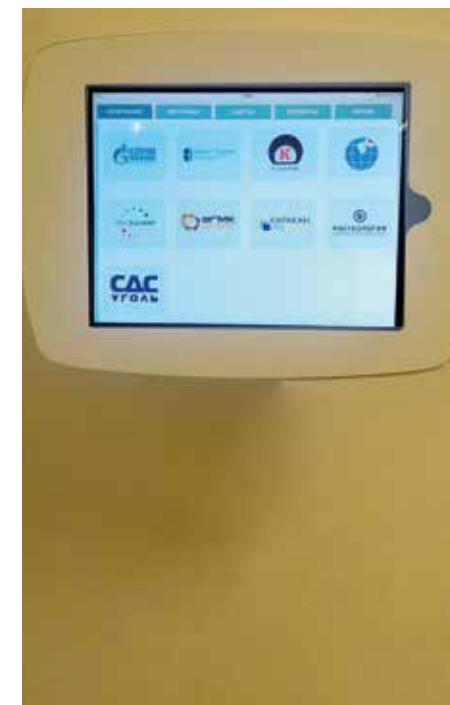
Видеостена в экспозиции "Богатство недр России" (Минералогический зал)