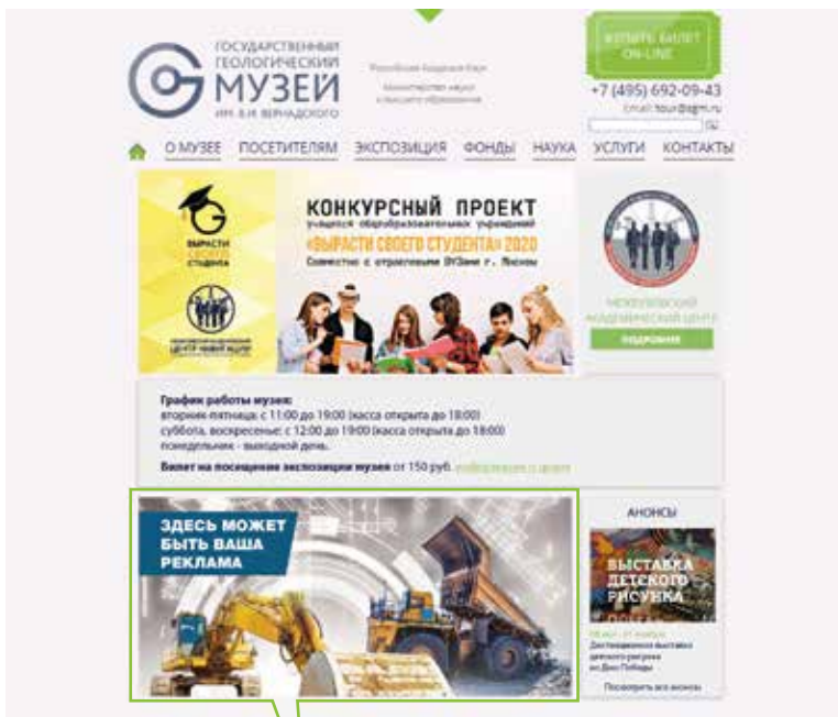
Баннер на сайте www.sgm.ru