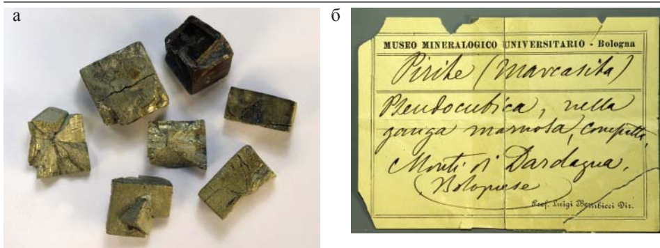
Рис. 12 а, б. Пирит, кристаллы. Окрестности Болоньи, Италия. Этикетка Минералогического музея в Болонье. Дар директора музея профессора Л. Бомбиччи, 1898 г. Кристаллы от 0.5×1 до 0.5×3 см. Инв. МН-16188