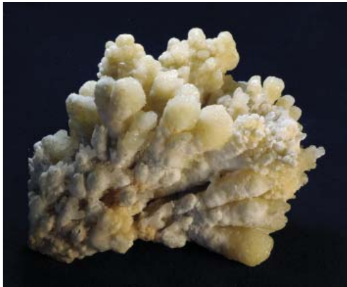
Рис. 14. Кальцит – гроздевидное образование. Тюя-Муюн, Алайский хр., Ю. Киргизия. Сбор К.А. Ненадкевича, 1907 г. 14×12×6 см. Инв. МН-28688