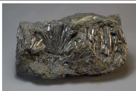
Рис. 3. Цилиндрит. Поопо, Боливия. Куплен в конторе Фрайбергской горной академии, 1899 г. Открыт в 1893 г. 11×6×3 см. Инв. МН-20725