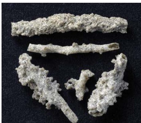
Рис. 9. Фульгурит. Окрестности Полтавы. Сбор В.И. Вернадского, 1901 г. Фрагменты от 0.5 \times 1 до 0.5 \times 3 см. Инв. МН-8143