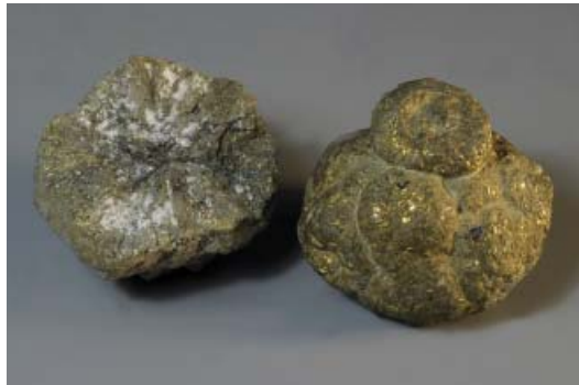
Рис. 13. Конкреции пирита. П-ов Кара-Тюн, Аральское море, Казахстан. Дар Л.С. Берга, 1900 г. 3×3×1.2 и 3×2×1.2 см. Инв. МН-16629