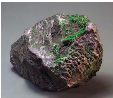
Рис. 11. Уваровит и хромистый клинохлор (кеммеририт) на хромите. Билимбаевский рудник, Урал. Сбор П.К. Алексата, 1905 г. 10.5 \times 8 \times 5 см. Инв. МН-62259