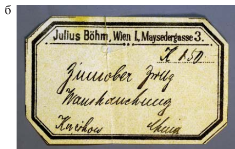
Рис. 6а, 6б. Киноварь. Ван-Шан-Чанг, Китай. Куплен у J. Bohm (Вена), 1909 г. Кристалл 1.5×1×1 см. Инв. МН-20687