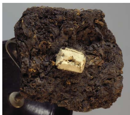
Рис. 4. Струвит. Гамбург (type locality), Германия. Куплен у H. Minod (Женева), 1904 г. 4×3×2 см. Инв. МН-22255