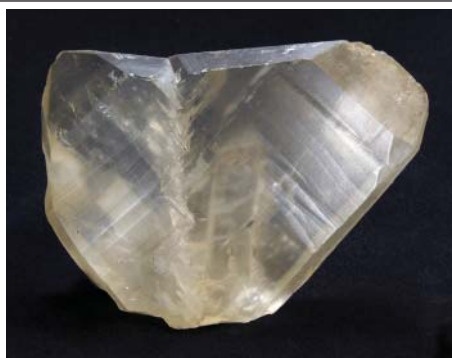
Рис. 8. Кварц – «японский двойник». Отomezака, провинция Яманаси, Япония. Куплен у А. Foote (Филадельфия), 1905 г. 9.5 \times 6.5 \times 2.4 см. Инв. 20983