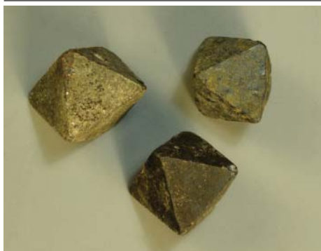
Рис. 7. Гауерит. Раддуза, о. Сицилия, Италия. Куплен у Ф. Шеера (Москва), 1892 г. Кристаллы 1.3 \times 1.2 \times 0.9 см. Инв. МН-28392