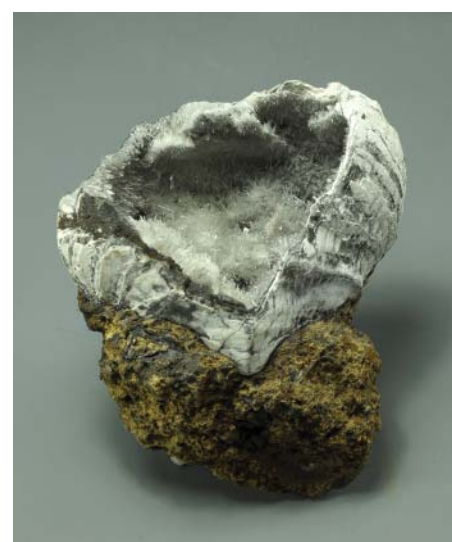
Рис. 10. Кристаллы гипса в раковине. Яньш-Такильский рудник, Керченское месторождение, Крым. Сборы В.И. Вернадского и С.П. Попова, 1899 г. 8 \times 7 \times 5 см. Инв. МН-41047