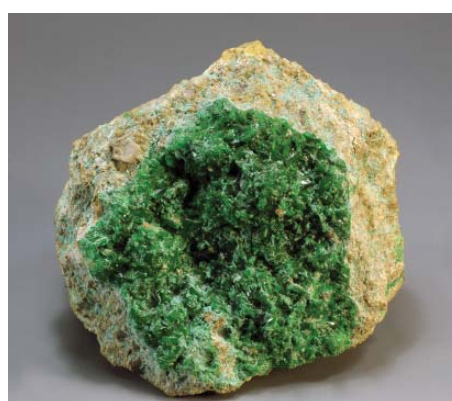
Рис. 5. Натрохальцит. Чукикамата (type locality), Чили. Куплен у A. Foote (Филадельфия), 1909 г. Открыт в 1908 г. 7×7×5 см. Инв. МН-22375