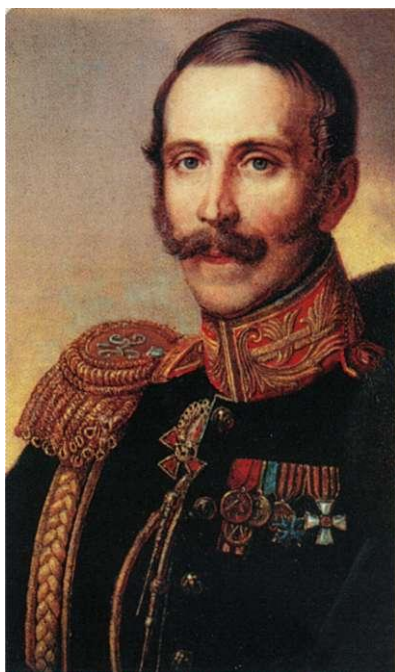
1. С.Г. Строганов (1794-1882). Портрет неизвестного художника, 1830-1840 гг. (холст, масло. 38.5 x 31.5 см) Хранится в Музее землеведения МГУ им. М.В. Ломоносова.

Государственный геологический музей им. В.И. Вернадского РАН. zoza@sgm.ru