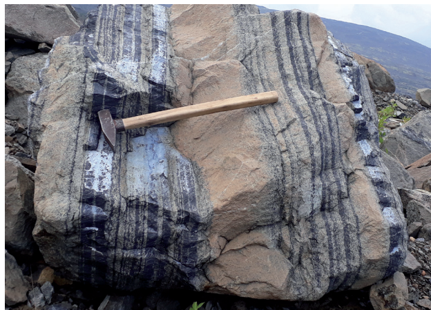
Рис. 3. Хромитовые руды Сопчеозерского месторождения.

Начало научной деятельности было посвящено изучению рудных интрузий Восточ-