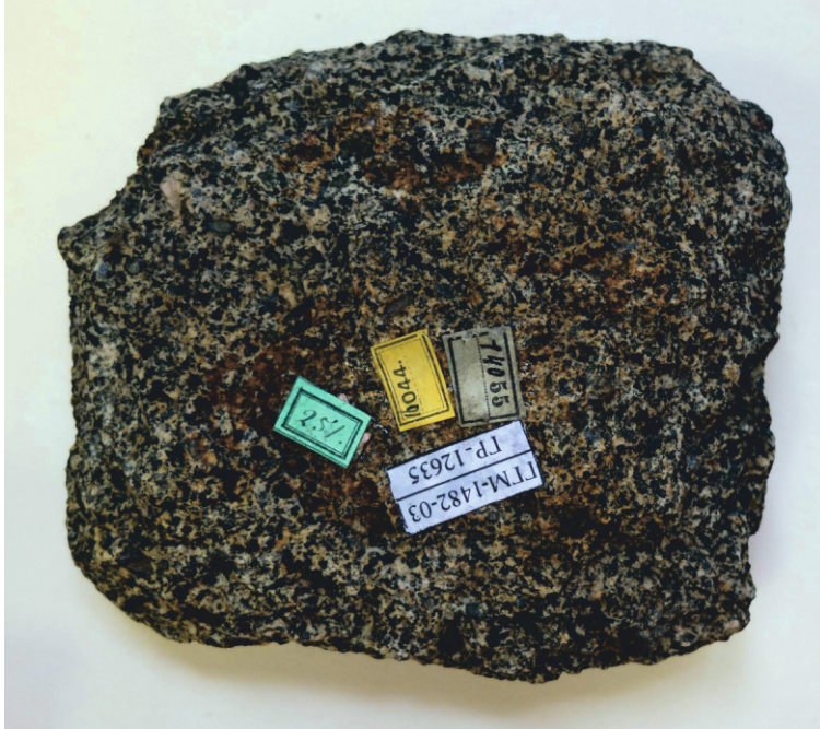
Рис. 4. Габбродиорит роговообманковый. Окрестности гор. Нижняя Тура, Урал, Россия. 10,5х9х3 см. ГГМ РАН. Инв. ГР-12635