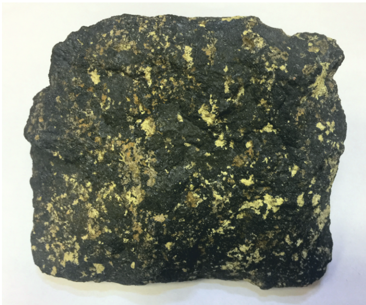
Рис. 5. Магнетитовая руда Гороблагодатское месторождение, Урал, Россия. 10х9х4 см. ГГМ РАН. Инв. ГР-02040