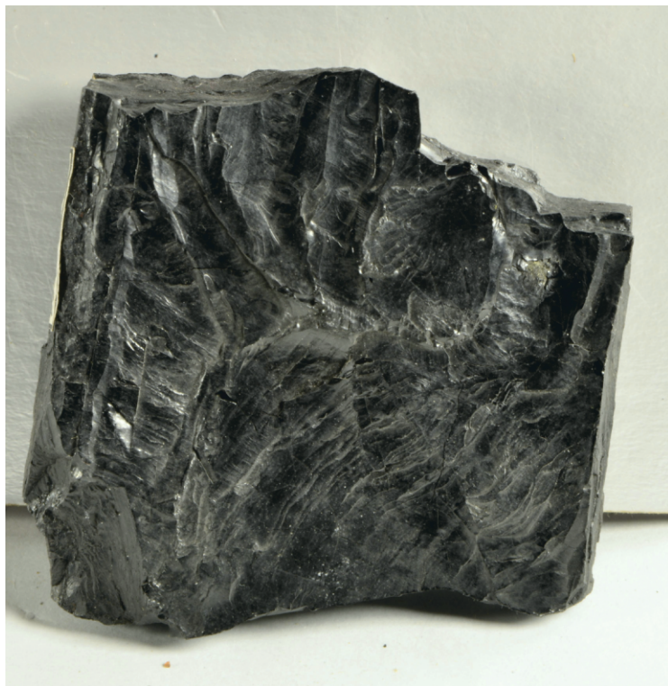
Рис. 6. Каменный уголь. г. Лисичанск, Донбасс, Украина. 6х6х1,5 см. ГГМ РАН. Инв. ГР-12811