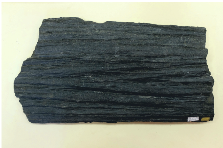
Рис. 7. Lepidodendron obovatum Stern. дер. Городище, Луганская обл., Украина. 30х19х1,8 см. ГГМ РАН. Инв. ФЛ-06913