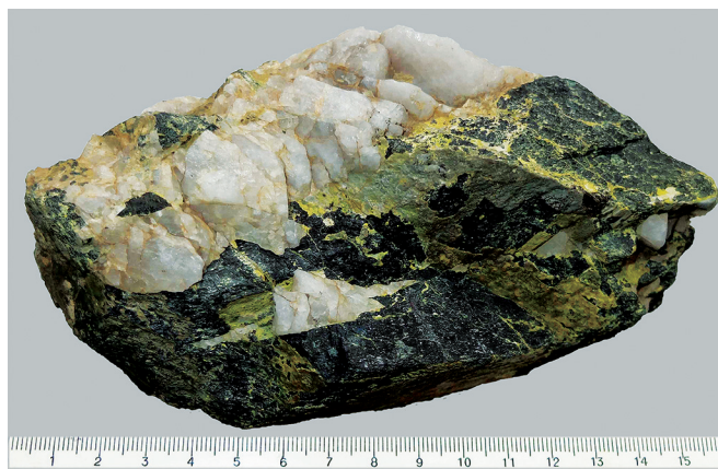
Рис. 2. Вольфрамит с тунгситом. № ГР-04168. Фонды ГГМ РАН

крывателю месторождения В.Н. Миляеву определить главные минералы в первый же день открытия месторождения. Первые образцы касситерита, взятые с поверхности, не всегда отличаются привлекательностью. Позднее Иультинское месторождение славилось красивыми, крупными коллекционными кристаллами касситерита, широко представленными во многих минералогических музеях мира и в частных коллекциях.