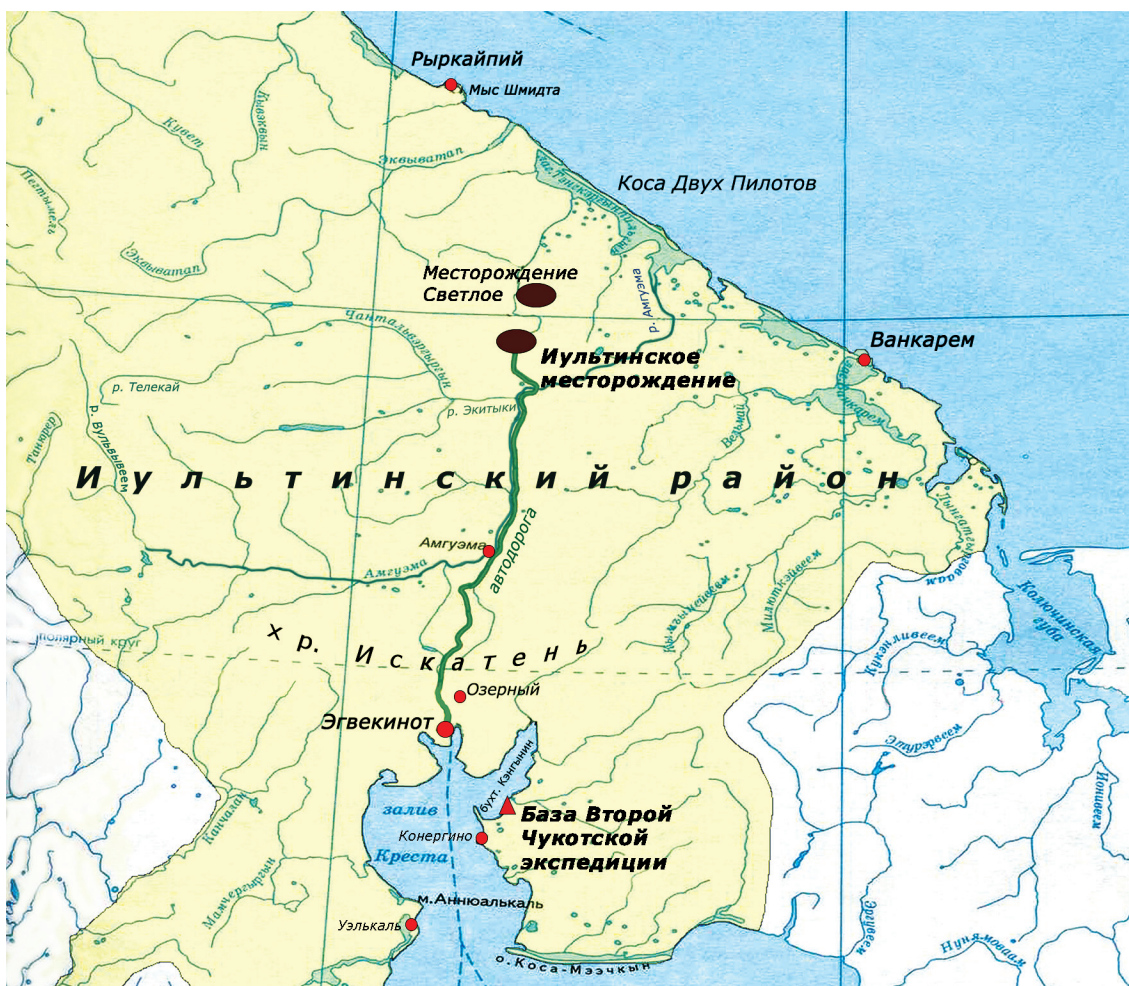
Рис. 3. Схематическая карта района работ Второй Чукотской экспедиции Главсевморпути.

участки склонов и, что было особенно важным, преодолевали высокий и скалистый хребет Искатень, который находился между базой экспедиции в заливе Креста и долиной р. Амгуэма. М.Н. Каминский писал: «В наши дни полёт без радиосвязи, без обеспечения полёта погодой и аэродромом — лётное преступление, а тогда иначе и летать было нельзя» [6, с. 295]. С помощью авиации экспедиция М.Ф. Зяблова исследовала огромную площадь, почти весь бассейн р. Амгуэма, выявила небольшие рудопоявления полиметаллов, молибдена, мышьяка, но «точку Серпухова» найти не удалось.