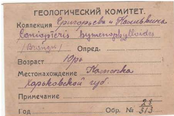
Рис. 1. Этикетки Геолкома в коллекции Н.В. Григорьева

Геологическая наука потеряла двух молодых талантливых ученых: В.А. Наливкина и Н.В. Григорьева. После смерти Н.В. Григорьева изучение ископаемой юрской флоры Европейской России временно приостановилось (Шмальгаузен, 1988).