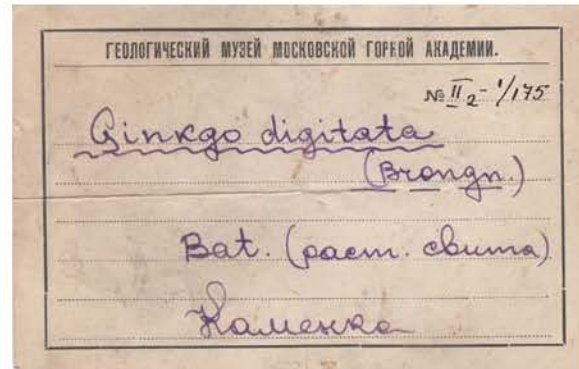
Рис. 2. Этикетки Горной академии в коллекции Н.В. Григорьева