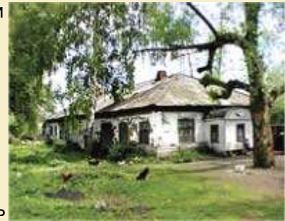
Школа в Вернадовке, которую В.И. Вернадский построил и содержал на свои средства