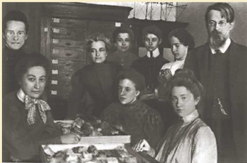
В.И. Вернадский со слушателями высших женских курсов

«Нет сейчас вопроса более срочного и более важного, чем вопрос о народном образовании». В.И. Вернадский «Организация народного образования в новой России» 1920 г.