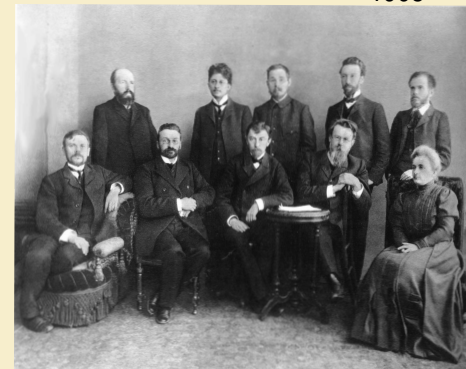
В.И. Вернадский с членами минералогического кружка Московского университета.

За период с 1901 по 1917 год В. И. Вернадский опубликовал свыше 30 статей по вопросам народного просвещения.