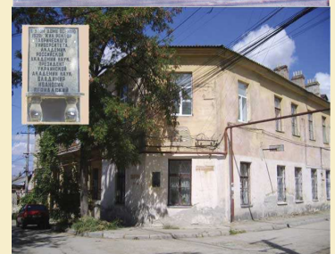
Таврический университет, где с 1919 по 1921гг. В.И. Вернадский был ректором и дом в котором он жил.