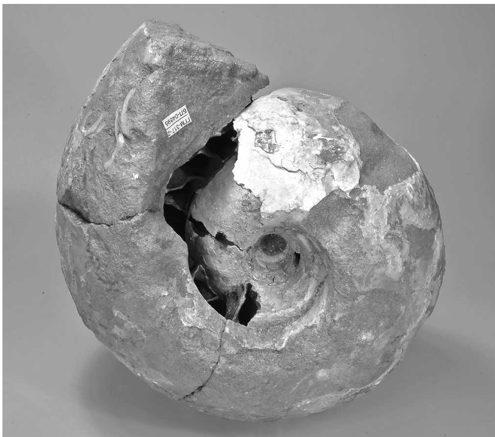
Фото 4. Rondiceras sokolovi (Kiselev). Фонды ГГМ РАН