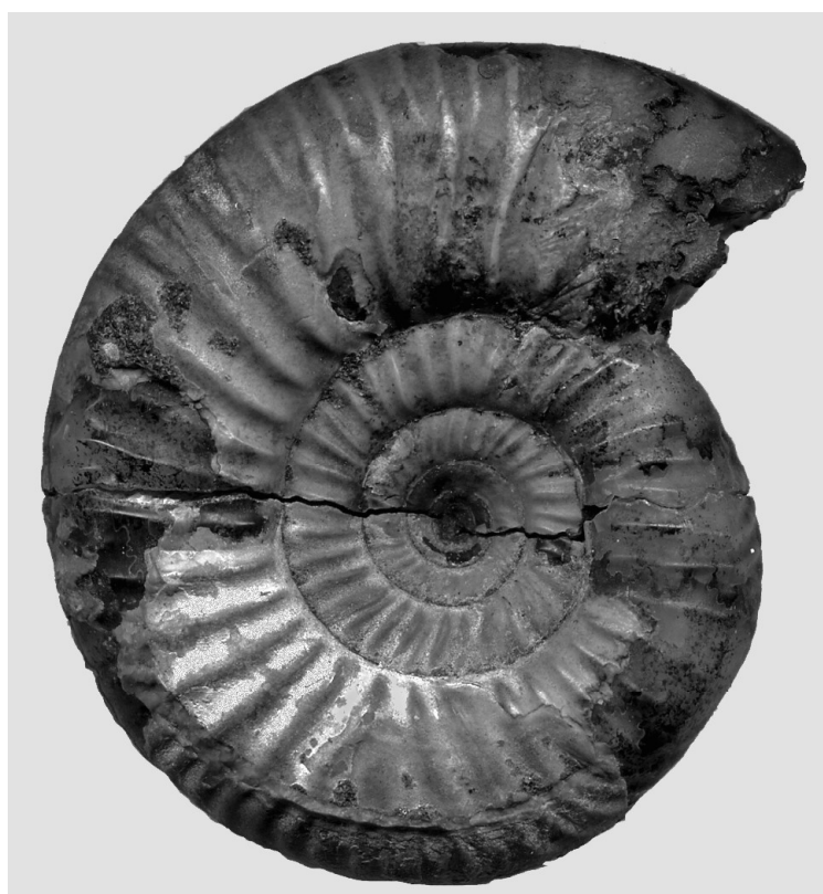
Фото 2. Elatmites nikitinoensis Sasonov. x2. Голотип. Фонды ГГМ РАН